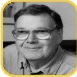
Dr. John Holland

जॉन लुईस हॉलैंड (21 अक्टूबर, 1919 - 27 नवंबर, 2008) जॉन्स हॉपकिन्स विश्वविद्यालय में समाजशास्त्र के प्रोफेसर एमेरिटस और अमेरिकी मनोवैज्ञानिक थे। वह 27 नवंबर, 2008 को केंद्रीय मेमोरियल अस्पताल में निधन हो गया। हॉलैंड को कैरियर डेवलपमेंट मॉडल, हॉलैंड ऑक्युपेशनल थीम्स के निर्माता के रूप में सबसे अच्छा जाना जाता है। स्नातक स्तर की पढ़ाई के बाद, हॉलैंड ने 4 वर्षों तक सेना में सेवा की, उन्होंने एक वर्गीकरण साक्षात्कारकर्ता, परीक्षण प्रोजेक्टर, मनोवैज्ञानिक सहायक और वीक्स्लर परीक्षण प्रशासक के रूप में काम किया।